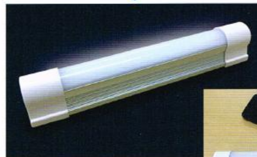
▲磁石で取り付けるので設置も移動も簡単!